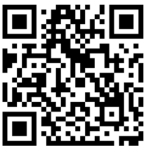
วิดีโอประสบการณ์ การเปลี่ยนแปลง

ช่วงอายุ 12 ปีผมติดเกมหนักมาก ต้องขโมยเงินพ่อมาเติมเกม และไม่สามารถเรียนได้ ต่อมาย้ายเข้าโรงเรียนใหม่ช่วงชั้นมัธยมศึกษาปีที่ 1 ก็ไม่ตั้งใจเรียนเหมือนเดิม เริ่มสูบบุหรี่กินเหล้า และเสพยากับเพื่อน เวลามองไปที่เพื่อนคนอื่น ก็เห็นว่าเรียนจบไปหมดแล้ว แต่ผมกลับเสพยาหนักขึ้น และขายยาในโรงเรียน ตั้งแก๊งและทะเลาะตอแยติดตามงานต่าง ๆ ต่อมาได้ก่อคดีร้ายแรง ร่วมมือฆ่าคน จนต้องจบอนาคตที่สถานพินิจ เมื่อรับโทษตามกระบวนการ และออกมาสู่โลกภายนอก ความคิดแรกที่เกิดขึ้นคือ ผมอยากเปลี่ยนแปลงตัวเองเป็นคนใหม่ จึงได้ไปฝึกเป็นนักมวยอยู่ในค่ายใกล้บ้าน เพราะคิดว่าจะทำให้ผมเปลี่ยนแปลง ช่วงแรกก็ตั้งใจฝึกได้ แต่สุดท้ายก็ทนไม่ไหว กลับไปเสพยาเหมือนเดิม จนเริ่มรู้สึกว่าตัวเองอาจจะมีอาการทางจิต จึงพยายามหาสถานบำบัด และโรงพยาบาลจิตเวช เพราะได้รู้ตัวแล้วว่าตัวเองมีความคิดที่ไม่อยากอยู่บนโลกใบนี้ ถ้าปล่อยไปก็แค่ฆ่าตัวตาย