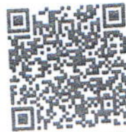
รายละเอียดกิจกรรม

๗.๒ ส่งผลงานเข้าร่วมการประกวด ทางไปรษณีย์อิเล็กทรอนิกส์ที่ culture.scm2@gmail.com ภายในวันที่ ๒๒ ธันวาคม ๒๕๖๖ เวลา ๑๖.๓๐ น. ประกอบด้วย