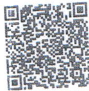
QR Code รับสมัคร

๗.๑ สมัครผ่านระบบออนไลน์ https://shorturl.asia/9X63Z หรือตาม QR Code ด้านล่าง ภายในวันที่ ๒๒ ธันวาคม ๒๕๖๖ เวลา ๑๖.๓๐ น.