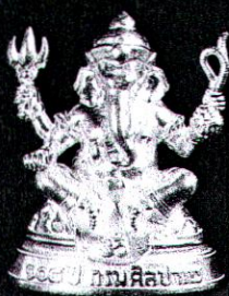
เนื้อเงิน