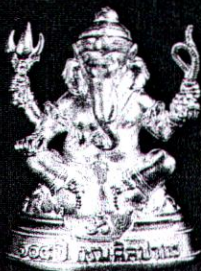
เนื้อทองคำ