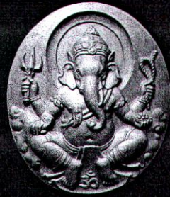
พระพิฆเนศวรเหรียญรูปไข่