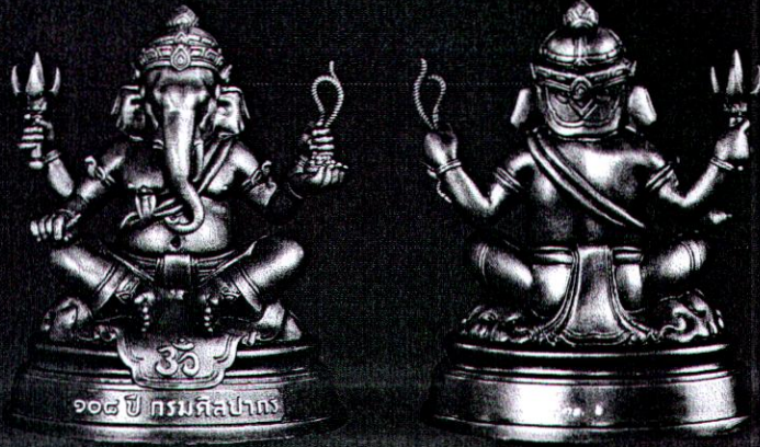
พระพิฆเนศวรบุชาและพระพิฆเนศวรลอยองค์ (พระชัยวัฒน์)