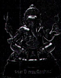
เนื้อทองเหลือง (รมดำ)