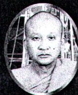
พระมงคลลาวโรปการ (หลวงพ่อบุญ อุตตมปณฺโญ) วัดชินวรารามวรวิหาร ต.บางชะแยง อ.เมือง จ.ปทุมธานี