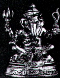
เนื้อบรอนซ์