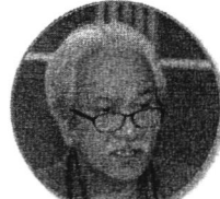
สายธารสีป